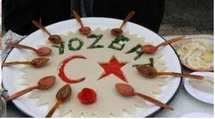
Arabaşı çorbası ve hamuru