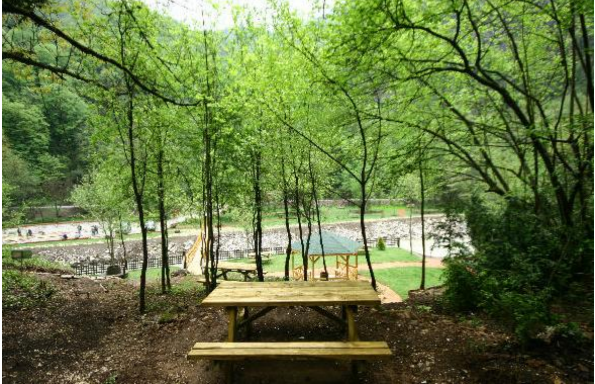
Çamlık Milli Parkı

İçerisinde bulunan çam çeşidinin bir benzerinin sadece Kafkaslarda olduğu bilim adamlarınca tespit edilmiştir.