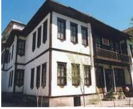
Nizamođlu konađı (Yozgat Müzesi)