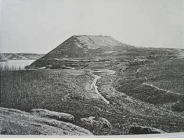
Kargamış antik kentinin kuzeybatıdan genel görünüşü

Kentin yapısı: Dış kent, iç kent ve kale olmak üzere üç kesimden oluşan Kargamış, dikdörtgen bir yerleşim planına oturmaktadır.