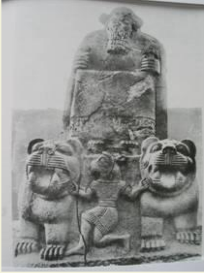
Aslanlı kaide üzerinde oturan kral heykeli