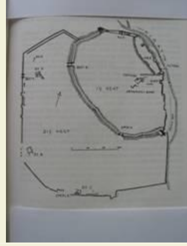
Kargamış antik kentinin planı

Kargamış kenti, taş temel üstüne kerpiç duvarlı surlarla çevrilidir. Dış sur, çift duvar tekniğindedir. Üçü iç surda, ikisi dış surda olmak üzere beş kent kapısı vardır. Kule, burç ve poternlerle güçlendirilmiş olan bu savunma sistemi, Hitit imparatorluk ve Geç Hitit dönemlerinde yapılmıştır.