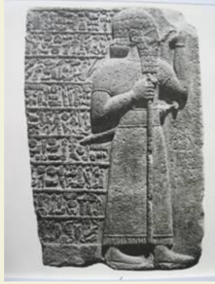
Kral Katuvas (Pisiris)'ın hiyeroglif yazıtlı kabartması

Kazılardan çıkartılan eserlerin buldukları yerler: Kazılardan çıkartılan eserlerden kimileri İngiltere'deki British Museum, Almanya'daki Berlin Müzesi, Türkiye'deki Ankara Anadolu Uygarlıkları Müzesi, Adana Müzesi, Gaziantep Müzesinde yer alırken, bilimsel yayınlarda geçen kimilerinin de hangi ülkede ve müzede oldukları bilinmiyor.